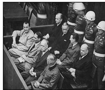
图：纽伦堡审判历史图片

【明慧网】在 60 多年前对德国纳粹罪行进行审判的纽伦堡审判，是人类有史以来最大规模的审判。审判一开始，所有纳粹战犯用同一个理由为自己辩护：“执行法律的人不受法律追究，杀害犹太人是执行法律。”希特勒通过法治实施专制和运用法律灭绝种族。对待犹太人，第