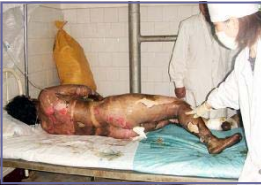
左图：“自焚”者被全身紧包 右图：真正的烧伤病患

大面积烧伤病人的创伤面为了换药方便，本应尽量暴露，不能用药布包裹烧伤部位，但电视上的“自焚”者却全身包裹严密，丝毫不符合基本的医学常识。