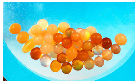
释迦牟尼佛七彩舍利 Shakyamuni Buddha Seven Colour Head Shrine

有关释迦牟尼的一些事情，历史流传下来的很多佛经中都有记载。释迦牟尼是古印度迦毗罗卫国（今尼泊尔境内）的太子。19 岁时，他有感于人世生、老、病、死等诸多苦恼，舍弃王族生活，出家修行。35 岁在菩提树