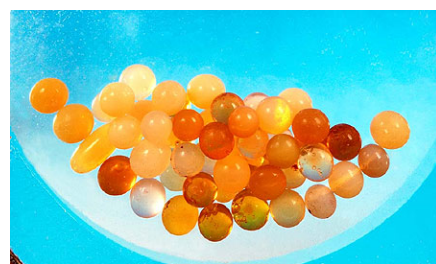
释迦牟尼佛七宝舍利 Shakyamuni Buddha Seven Colour Head Shrine

有关释迦牟尼的一些事情，历史流传下来的很多佛经中都有记载。释迦牟尼是古印度迦毗罗卫国（今尼泊尔境内）的太子。19岁时，他有感于人世生、老、病、死等诸多苦恼，舍弃王族生活，出家修行。35岁在菩提树下悟道，弘法49年，80岁左右涅槃。弟子们在火化他的遗体时从灰烬中得到了84000颗珠状真身舍利子（图）。这些舍利子晶亮透明、五光十色、坚硬如钢。公元前三世纪阿育王统一印度后，将佛的舍利分送世界各国建塔供奉，中国有十九处。