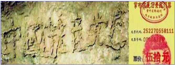
▲贵州省平塘县风景区内距今 2.7 亿年的“藏字石”，石头断面上天然形成六个字：中国共产党亡(上图风景区门票)。而国内媒体报道时都隐去了最后一个“亡”字。

是这个邪恶的党（魔教）在历史上却对众生、对神佛犯下了滔天大罪，神一定要清算这个恶魔。