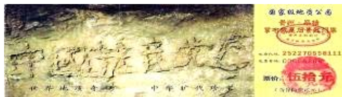
贵州省平塘县掌布乡风景区门票

“藏字石”上至今未发现人工雕凿及其它人为加工痕迹，堪称世界级奇观，具有不可估量的地质研究价值。