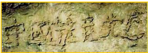
■ 二零零二年六月，贵州省平塘县风景区惊

天网恢恢，善恶分明；苦海有边，生死一念。曾被历史上最邪恶的魔教所欺骗的人，曾被邪恶打上兽的印记的人，请抓住这稍纵即逝的良机。