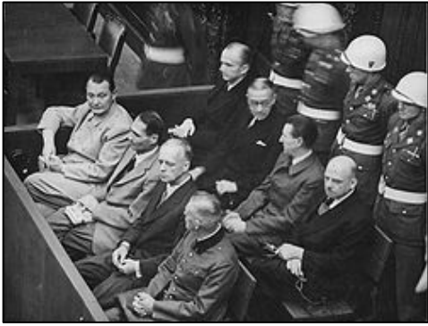
图：纽伦堡审判历史图片

【明慧网】在 60 多年前对德国纳粹罪行进行审判的纽伦堡审判，是人类有史以来最大规模的审判。审判一开始，所有纳粹战犯用同一个理由为自己辩护：“执行法律的人不受法律追究，杀害犹太人是执行法律。”希特勒通过法治实施专制和运用法律灭绝种族。对待犹太人，第一步通过立法进行身份上的区分，使犹太人与其他人区别开来；第二步通过立法禁止犹太人经商，切断了犹太人的财富来源；第三步通过强制劳役法，使有劳动能力的犹太