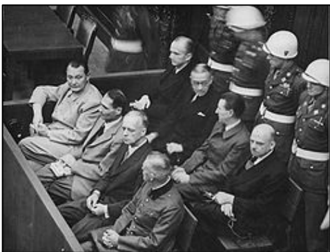
图：纽伦堡审判历史图片

【明慧网】在 60 多年前对德国纳粹罪行进行审判的纽伦堡审判，是人类有史以来最大规模的审判。审判一开始，所有纳粹战犯用同一个理由为自己辩护：“执行法律的人不受法律追究，杀害犹太人是执行法律。”希特勒通过法治实施专制和运用法律灭绝种族。对待犹太人，第一步通过立法进行身份上的区分，使犹太人与其他人区别开来；第二步通过立法禁止犹太人经商，切断了犹太人的财富来源；第三步通过强制劳役法，使有劳动能力的犹太