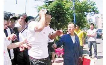
升旗杆铁钩钩住老师头部

事情发生在2009年6月22日，吉林省第二实验学校按照规定，该校体育老师组织学生举行升旗仪式。升旗过程中，移动杆突然坠落，一根长约1.5米的移动杆的铁钩钩住了他的头部，钩入部分约有5厘米。由于杆长，救援官兵先用断电剪将铁钩以下的移动杆固定住，然后用液压剪将其余部分剪掉，后送往医院。