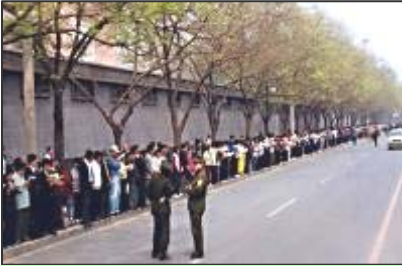
“4·25”和平上访——法轮功学员文明安静，学员背后不是中南海红墙，中共造谣的所谓“围攻中南海”根本不存在。有人认为：1999年“4·25”和平上访是导致中共迫害法轮功的原因。其实不然。中共从1996年起就有预谋的系统实施对法轮功的打压了。三年中，打压不断升级。最后警察殴打及非法抓捕法轮功学员的“天津事件”，引发了“4·25”法轮功学员万人和平上访。

共使领馆以及联合国和平请愿，等等各种各样的举措，希望中共了解真相，能纠正错误，惩治恶首，停止迫害。