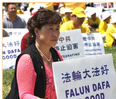
■二零零九年七月，金女士来到美国华盛顿讲真相。

“当我站在正常人的良知上思考，我觉得我上当了。”（其实很多人都看出了央视的“天安门自焚”漏洞百出，如：塑料汽油瓶在大火中竟然不燃烧、不变形；“自焚”小女孩气管切开还能唱歌，等等。）