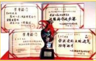
李洪志老师参加 1993 年东方健康博览会获得奖杯和奖状

一九九三年春天，师父来武汉传法，当时是在中央部级科研单位的礼堂举办的学习班。有一件事我终身难忘。当时办班一期是十天，师父每天要用一个半小时以上为大家讲法，然后再教练功动作。在学习班开始后的一天，有一个年约 40 多岁、瘦高个的男子，因没有学习班的听课证非要进去不可，被工作人员拦下，并向他说明要凭听课证才能进去。他不但不听劝阻，反而大吵大闹：我来就是和他（指师父）斗法的，我的师父 100 多岁了，他这么年轻……这男子说了很多不好的话。后来这事