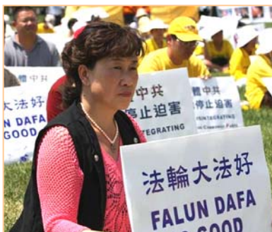
■ 二零零九年七月，金女士来到美国华盛顿讲真相。

“当我站在正常人的良知上思考，我觉得我上当了。”（其实很多人都看出了央视的“天安门自焚”漏洞百出，如：塑料汽油瓶在大火中竟然不燃烧、不变形；“自焚”小女孩气管切开还能唱歌，等等。）