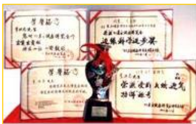
■李洪志老师参加 1993 年东方健康博览会获得奖杯和奖状

一九九三年春天，师父来武汉传法，当时是在中央部级科研单位的礼堂举办的学习班。有一件事我终身难忘。当时办班一期是十天，师父每天要用一个半小时以上为大家讲法，然后再教练功动作。在学习班开始后的一天，有一个年约 40 多岁、瘦高个的男子，因没有学习班的听课证非要进去不可，被工作人员拦下，并向他说明要凭听课证才能进去。他不但不听劝阻，反而大吵大闹：我来就是和他（指师父）斗法的，我的师父 100 多岁了，他这么年轻……这男子说了很多不好的话。后来这事