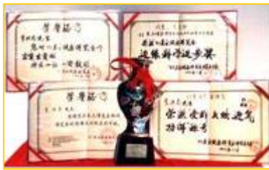
■李洪志老师参加 1993 年东方健康博览会获得奖杯和奖状

一九九三年春天，师父来武汉传法，当时是在中央部级科研单位的礼堂举办的学习班。有一件事我终身难忘。当时办班一期是十天，师父每天要用一个半小时以上为大家讲法，然后再教练功动作。在学习班开始后的一天，有一个年约 40 多岁、瘦高个的男子，因没有学习班的听课证非要进去不可，被工作人员拦下，并向他说明要凭听课证才能进去。他不但不听劝阻，反而大吵大闹：我来就是和他（指师父）斗法的，我的师父 100 多岁了，他这么年轻……这男子说了很多不好的话。后来这事