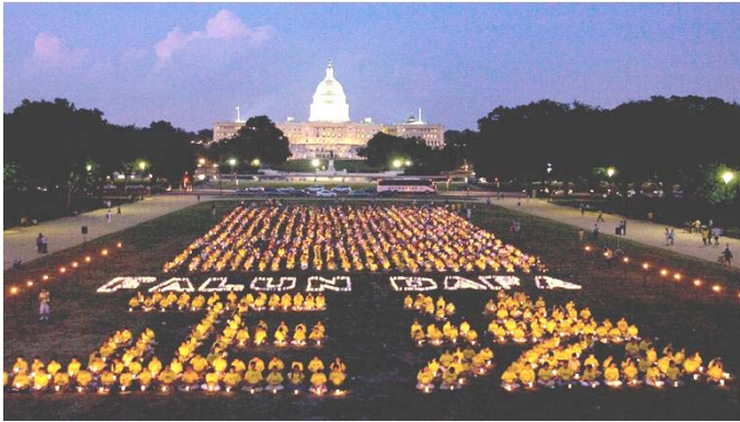
二零零九年七月十六日晚，美国国会山前法轮功学员烛光集会，悼念十年来被中共迫害致死的大陆同修，并组字“正法”和英文“法轮大法”。

【明慧网】二零零九年七月二十日，法轮功学员反迫害十周年之际，在亚、美、欧、澳各国的大集会和游行纷纷举行，呼吁更多人关注对法轮功的迫害，认清中共的邪恶，共同制止迫害。