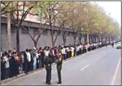
■“4·25”和平上访——法轮功学员文明安静，学员背后不是中南海红墙，中共造谣的所谓“围攻中南海”根本不存在。有人认为：1999年“4·25”和平上访是导致中共迫害法轮功的原因。其实不然。中共从1996年起就有预谋的系统实施对法轮功的打压了。三年中，打压不断升级。最后警察殴打及非法抓捕法轮功学员的“天津事件”，引发了“4·25”法轮功学员万人和平上访。

从1999年7月20日中共对法轮功的全面迫害一开始，法轮功学员就不断地给中共领导人写信澄清事实，去有关部门上访述说自己如何得法受益，到天安门展示“法轮大法好”的横幅，后来，进一步揭露并要求惩治恶首江泽民及其帮凶罗干、刘京、周永康，制作并散发揭露谎言和酷刑迫害的有关资料，电视插播真相，海外学员到世界各地的中共使领馆以及联合国和平请愿，等等各种各样的举措，希望中共了解真相，能纠正错误，