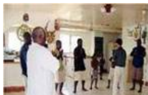
■南太平洋岛国—巴 布亚新几内亚前副 总理及家人学炼法轮功

●法轮大法已洪传世界一百一十四个国家和地区（其中亚洲：三十二国；美洲：二十一国；欧洲：四十六国；大洋洲：三国；非洲：十二国）。