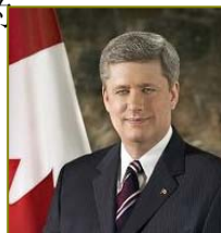
加拿大总理哈珀 致信贺大法日

●各国、各地政府和团体组织纷纷颁发褒奖、通过支持议案，及宣布“法轮大法月”、“法轮大法周”和“法轮大法日”，以各种形式支持法轮大法。至今，法轮大法主要书籍已被翻译成三十八种语言。