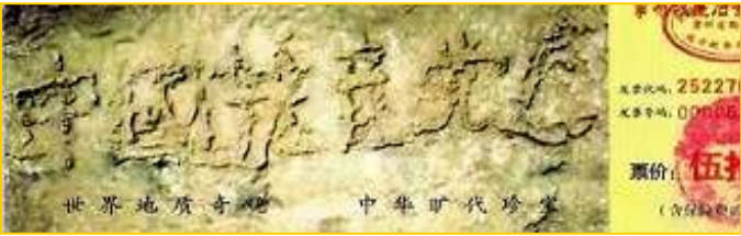
▲ 2002 年在贵州平塘县掌布乡发现的藏字石，石头断面上天然形成六个字：中国共产党亡，昭示着“天灭中共”的天意。图为风景区门票。

电话：1-347-448-5790；传真：1-347-402-1444； 邮信地址：P.O. Box 84, New York, NY 10116 网址： http://upholdjustice.org/ , http://zhuichaguoji.org