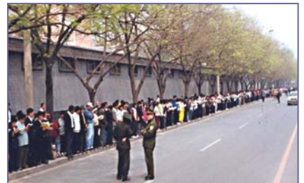
法轮功学员文明安静，警察不用维持秩序，在一旁聊天。学员背后不是中南海红墙，所谓的“围攻中南海”根本不存在。

江泽民叫嚣：“三个月消灭法轮功。”“我就不信共产党战胜不了法轮功。”江为专门镇压法轮功而成立的“610 办公室”凌驾于公、检、法、司法之上的非法组织。对信仰“真善忍”的法轮功修