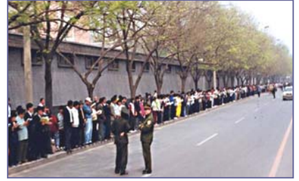
法轮功学员文明安静，警察不用维持秩序，在一旁聊天。学员背后不是中南海红墙，所谓的“围攻中南海”根本不存在。

江泽民叫嚣：“三个月消灭法轮功。”“我就不信共产党战胜不了法轮功。”江为专门镇压法轮功而成立的“610 办公室”凌驾于公、检、法、司法之上的非法组织。对信仰“真善忍”的法轮功修