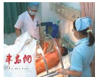
▲ 烧伤处应露在空气中，安置在无菌罩内。