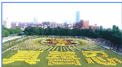
▲ 5000 多名武汉法轮功学员集体炼功，排组法轮图形和“真善忍”。(1997) 右图：老少皆炼法轮功 (《羊城晚报》1998.11.10)

● 法轮大法至今已洪传世界一百一十多个国家和地区，获得各国政府褒奖、支持议案、信函超过三千多项。法轮大法的主要著作《转法轮》已被译成三十多种文字，在全世界出版发行。