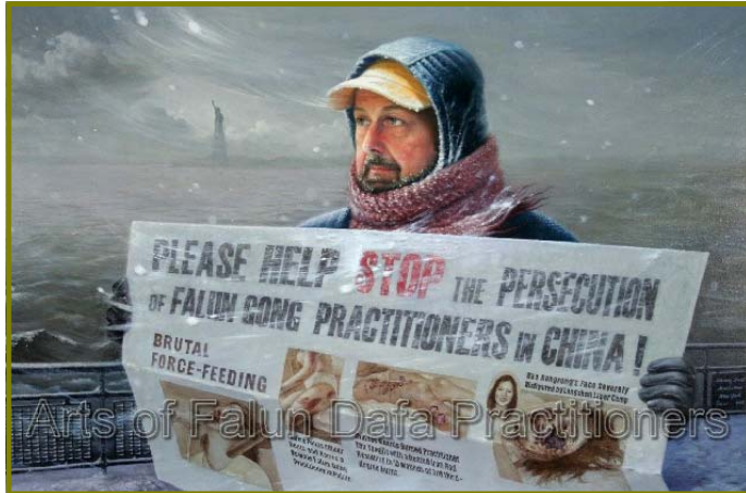
油画《在暴风雪中》，作者：汪卫星，(2005年)

简单做人也是一种境界，不为名利所累，不为物欲所动，在这种境界中，简单是一种平淡，但不是单调；简单是一种平凡，但不是平庸；简单是一种美，是一种原汁原味的美。（文/萧玉）◇