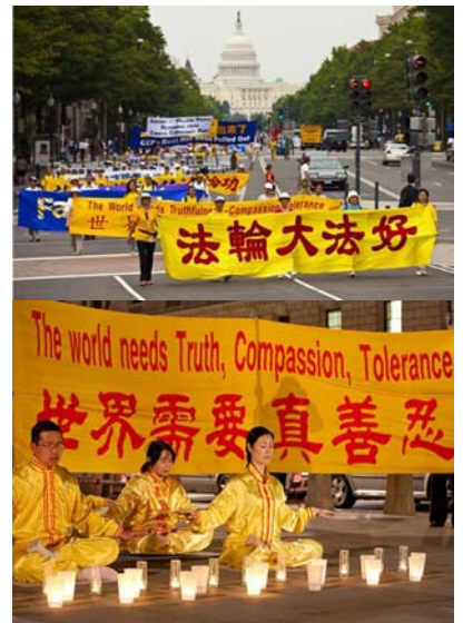
上：美国华盛顿DC的反迫害大游行 下：英国议会广场上的烛光夜悼

轮大法，或大法，是由李洪志先生于一九九二年五月传出的佛家上乘修炼大法，以“真善忍”为根本指导。经亿万人的修炼实践证明，法轮大法是大法大道，在把真正修炼的人带到高层次的同时，对稳定社会、提高人们的身体素质和道德水准，也起到了不可估量的正面作用。