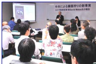
■ 中共活摘器官新证据报告

麦塔斯表示，法轮功不是一个组织，也不是一个群众运动，只有几套功法，加上精神上的原则。一个人不需要向任何人登记，或参加任何组织，就可以炼功，也可以随时放弃。法轮功的信息都是公开的。中共之所以打压法轮功，是因为法轮功所倡导的“真、善、忍”原则和中共奉行的残暴、迫害、说谎是对立的。对于一个歹徒来说，最可怕的就是遇到一个诚实的人，腐败的天敌就是那些拒绝收取贿赂的人。成千上万的中国人相信法轮功的原则，这使中共胆寒。因为中共的株连迫害，许多被绑架的法轮功学员为了不连累工作单位和家人，不说姓名及住址，这样他们很容易成了失踪的人，成了被活摘器官的受害者。