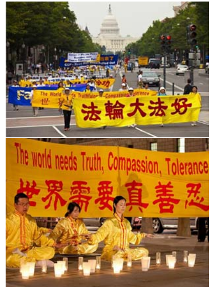
上：美国华盛顿DC的反迫害大游行 下：英国议会广场上的烛光夜悼

轮大法，或大法，是由李洪志先生于一九九二年五月传出的佛家上乘修炼大法，以“真善忍”为根本指导。经亿万人的修炼实践证明，法轮大法是大法大道，在把真正修炼的人带到高层次的同时，对稳定社会、提高人们的身体素质和道德水准，也起到了不可估量的正面作用。