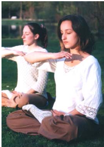
图：一对德国姐妹在炼功

法轮功也称法轮大法,是佛家上乘修炼大法,以“真善忍”为根本指导。经亿万人的修炼实践证明,法轮大法是大法大道,在把真正修炼的人带到高层次的同时,对稳定社会、提高人们的身体素质和道德水准,也起到了不可估量的正面作用。