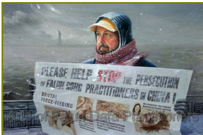
油画《在暴风雪中》，作者：汪卫星，(2005年)

简单做人也是一种境界，不为名利所累，不为物欲所动，在这种境界中，简单是一种平淡，但不是单调；简单是一种平凡，但不是平庸；简单是一种美，是一种原汁原味的美。（文/萧玉）◇