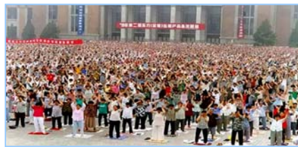
■ 沈阳万名法轮功学员集体炼功 (1998年)。