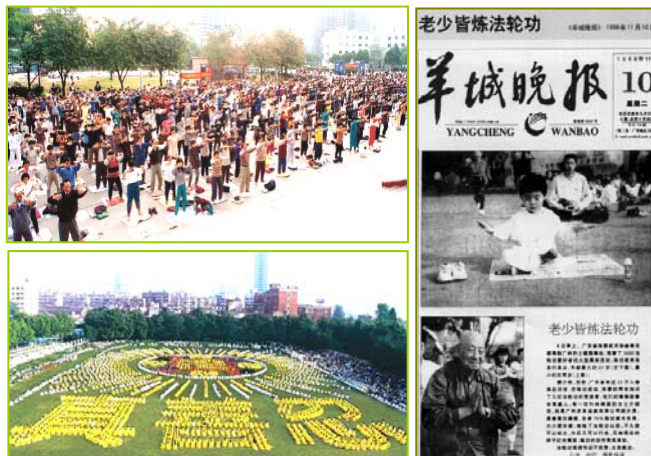
上图：1998年北京法轮功学员晨炼。下图：1997年武汉5000多法轮功学员炼功组字。法轮功1992年从中国传出，因对人类身心的巨大益处，倍受喜爱。右图：老少皆炼法轮功（《羊城晚报》

个危机四伏的环境中生存，试图用法律来改变现状，但是制定法律的人和维护法律的人却成了最大的违法者，当官的贪污腐败、当警察的打死百姓，监管部门贪赃枉法。有人面对道德日益败坏的人类社会，在网上发表文章《我还能活十年吗？》，文章代表了当今世界大多数人对人类未来的绝望！然而就在此时，法轮大法这部伟大的佛法——茫茫苦海中唯一的生命之舟，向我们驶来了！