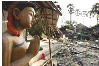
左图：泰国普吉岛，一尊完整的木雕佛像站立在一间被毁坏的潜水商店前。