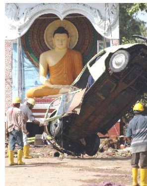
右图：斯里兰卡加勒寺庙前，佛像在海啸侵袭中丝毫无损。

对于无神论者来说简直不可思议，怎么解释都显得牵强；对于敬仰神佛者来说根本不用解释，一切都顺理成章。