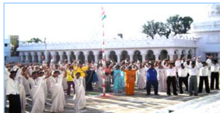
■ 在印度班加罗尔炼功 (2009.5)

◎ 法轮大法以宇宙特性“真善忍”指导人修心向善，从根本上祛除病疾、净化身心，给人指出一条返本归真的路。在短短的七年里，因其神奇功效，迅速传遍神州大地，修者上亿。