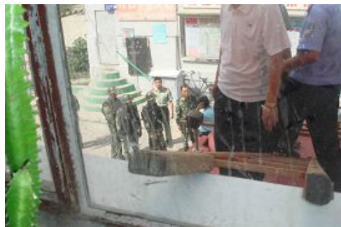
■ 派出所、安全局、国保大队及特警