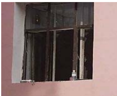
■ 玻璃被砸碎的窗户