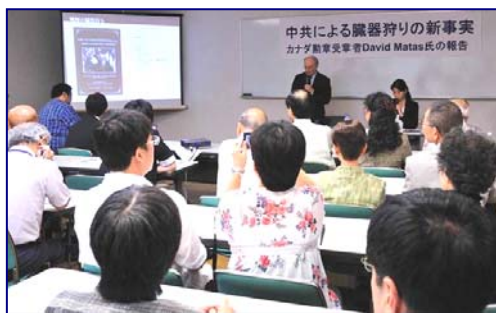
■中共活摘器官新证据报告会现场

几套功法，加上精神上的原则。一个人不需要向任何人登记，或参加任何组织，就可以炼功，也可以随时放弃。法轮功的信息都是公开的。中共之所以打压法轮功，是因为法轮功所倡导的“真、善、忍”原则和中共奉行的残暴、迫害、说谎是对立的。对于一个歹徒来说，最可怕的就是遇到一个诚实的人，腐败的天敌就是那些拒绝收取贿赂的人。成千上万的中国人相信法轮功的原则，这使中共胆寒。