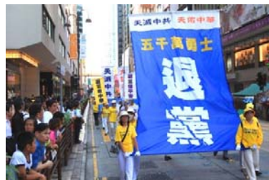
■ 香港声援三退大游行

【明慧网】辽宁省某戒毒所所长，前段时间到香港考察，看到了一个令他震惊的事实：在香港，法轮功学员传《九评共产党》（一本真实地揭露共产党邪恶本质