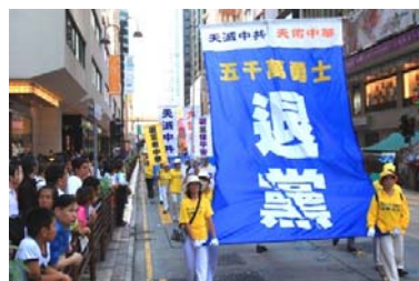
■ 香港声援三退大游行

【明慧网】辽宁省某戒毒所所长，前段时间到香港考察，看到了一个令他震惊的事实：在香港，法轮功学员传《九评共产党》（一本真实地揭露共产党邪恶本质