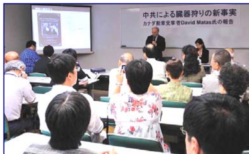
■ 中共活摘器官新证据报告会现场

几套功法，加上精神上的原则。一个人不需要向任何人登记，或参加任何组织，就可以炼功，也可以随时放弃。法轮功的信息都是公开的。中共之所以打压法轮功，是因为法轮功所倡导的“真、善、忍”原则和中共奉行的残暴、迫害、说谎是对立的。对于一个歹徒来说，最可怕的就是遇到一个诚实的人，腐败的天敌就是那些拒绝收取贿赂的人。成千上万的中国人相信法轮功的原则，这使中共胆寒。