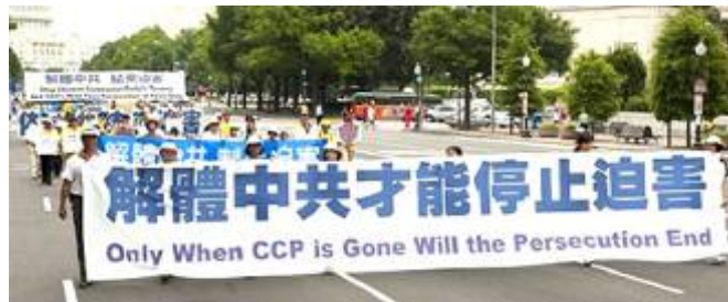
▲ 华盛顿反迫害十周年大游行。

中共把法轮功的善良民众强行推到了中共最大敌人的位置，也就决定了只有解体中共才能停止迫害的结局。文／欧阳非