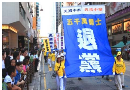
■ 香港声援三退大游行

这个消息一传出来，在戒毒所内引起了强烈的震动。听到这个消息的人，都有被中共政府欺骗的感觉，心里那种滋味真是难以言表。有一个警察气愤地说：“江泽民真坏！叫警察迫害法轮功，叫我们犯罪。”她还说：“一开始，我们还以为中央镇压法轮功是对的，可后来大批的法轮功被抓进戒毒所，先后有一千六七百人，一接触，发现炼法轮功的人都是好人。”这名警察明白真相后，在自己的职权范围内，多次保护法轮功学员。一名法轮功学员被绑架到派出所后，她亲自给派出所所长打电话，当天晚上这名法轮功学员就被释放了。◇