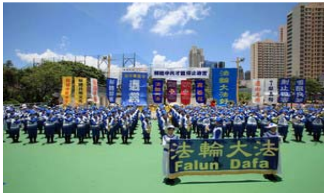
2009年7月12日，香港法轮功学员举行集会游行

这个消息一传出来，在戒毒所内引起了强烈的震动。听到这个消息的人，都有被中共政府欺骗的