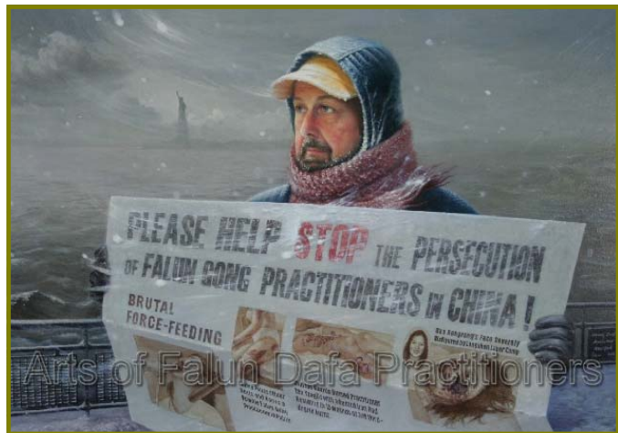
油画《在暴风雪中》，作者：汪卫星，(2005 年)

也许，在他的心中只有简单的两个字“良知”。简单做人也是一种境界，不为名利所累，不为物欲所动，在这种境界中，简单是一种平淡，但不是单调；简单是一种平凡，但不是平庸；简单是一种美，是一种原汁原味的美。（文/萧玉）◇