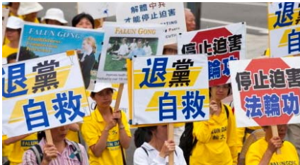
▲ 华盛顿反迫害十周年大游行。

中共在历次政治斗争中迫害死了八千万人，还活体摘取法轮功学员的器官，已经十恶不赦。而三退是为了废除加入中共时立下的把生命献给它的毒誓，是为了顺应天意保全性命。目前三退大潮的人数已经到达5900万，每天都有数以万计的人在海外大纪元网站声明三退。