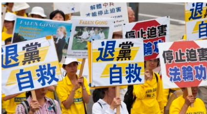
▲ 华盛顿反迫害十周年大游行。

中共在历次政治斗争中迫害死了八千万人，还活体摘取法轮功学员的器官，已经十恶不赦。而三退是为了废除加入中共时立下的把生命献给它的毒誓，是为了顺应天意保全性命。目前三退大潮的人数已经到达5900万，每天都有数以万计的人在海外大纪元网站声明三退。