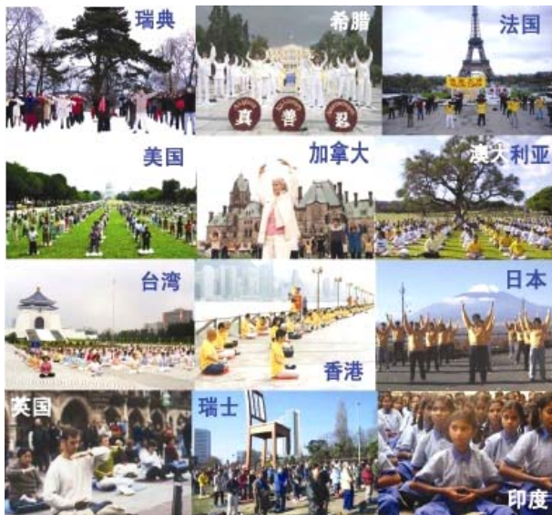
法轮大法洪传世界114个国家和地区