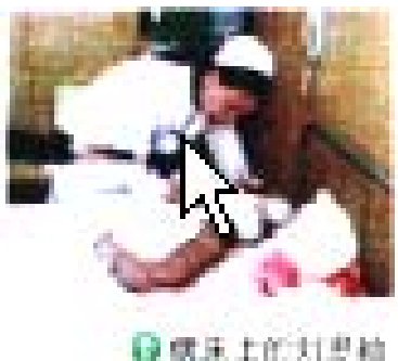
教材第七页里的图片

不做谎言的传话筒，救救这些可怜的孩子，智慧的教导孩子，跳出谎言的泥潭，走向光明。您的良知与善心会得到上天的福报。