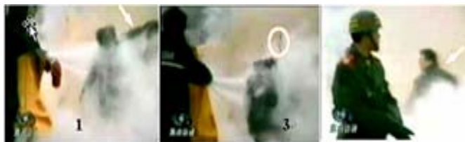
1. 刘头部受重击 2. 击打后飞出的重物 3. 击打者仍保持用力姿势,“焦点访谈”录像证实,刘春玲没被火烧死,却被便衣警察用重物击打头部倒下(实质是谋杀)。