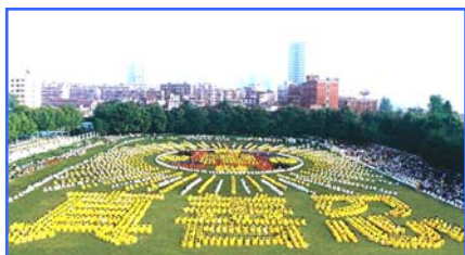
▲ 5000 多名武汉法轮功学员集体炼功，排组法轮图形和“真善忍”。(1997) 右图：老少皆炼法轮功 (《羊城晚报》1998.11.10)

● 法轮大法至今已洪传世界一百一十多个国家和地区，获得各国政府褒奖、支持议案、信函超过三千多项。法轮大法的主要著作《转法轮》已被译成三十多种文字，在全世界出版发行。