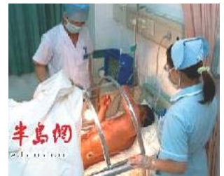
▲ 烧伤处应露在空气中，安置在无菌罩内。

轮功学员听到隔壁房间一声惨叫，有几个人跑过去问，还有气没有，死了没有，其实她当时就昏死过去了，四十多分钟后那位女法轮功学员才苏醒过来。劳教所看她身体不行了，封锁消息，不透露姓名，就把她放回家，放回后仍监视，没过多久，含冤去世了才罢休。湖南省白马垅劳教所是中共在中南地区迫害法轮功的邪恶基地，恶警们在对法轮功学员惨绝人寰的迫害中已丧失了人性。前不久，劳教所对全体干警作了健康普查，其中52名恶警中，就没一个没病的。现已有18人死亡、患绝症或遭其它严重恶报。