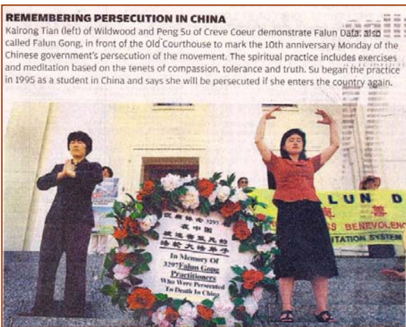
▲当地最大的报纸《圣路易斯邮报》以“记住发生在中国的迫害”为题作了报道

【明慧网】二零零九年的七月二十日，法轮功学员无辜遭中共残酷迫害长达十年之际，全球法轮功学员纷纷举行活动，让世人了解真相，呼吁共同结束中共的迫害。美国密苏里州法轮功学员在圣路易市中心、象征公正与自由的旧法院前，举办了反迫害集会。