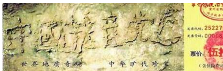
贵州藏字石天然断面上六个字：中国共产党亡，昭示着“天灭中共”的天意。图为风景区门票。

现如今有一个重大的选择摆在了我们面前，那就是“天灭中共、三退（退出中共党团队）保命”。中共在历次政治斗争中迫害死了八千万人，还活体摘取法轮功学员的器官，已经十恶不赦。而三退是为了废除加入中共时立下的把生命献给它的毒誓，是为了顺应天意保全性命。目前三退大潮的人数已经到达 5800 万，每天都有数以万计的人在海外大纪元网站声明三退。善良的朋友，愿您也能早日作出正确的选择。◇