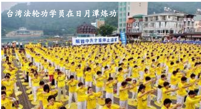
台湾法轮功学员在日月潭炼功