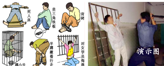
中共迫害法轮功学员酷刑图示

据不完全统计，1999 年 7.20 以来的六年中，通过民间途径能够传出消息的已有 3299 名法轮功学员被迫害致死，迫害致死案例分布在全中国 30 多个省、自治区、直辖市。早在 2001 年 10 月底，据中共官方内部统计，拘捕中的法轮功学员死亡人数已经高达 1600 人，几年过去了，随着迫害的继续，从民间渠道证实的被迫害致死的人数在逐日增加，而全国被非法判刑的法轮功学员至少有 6000 人，被非法劳教的人数超过 10 万人，数千人被强迫送入精神病院受到破坏中枢神经药物的摧残。