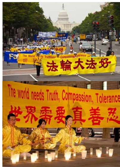
上：美国华盛顿DC的反迫害大游行 下：英国议会广场上的烛光夜悼

法轮功也称法轮大法，或大法，是由李洪志先生于一九九二年五月传出的佛家上乘修炼大法，以“真善忍”为根本指导。经亿万人的修炼实践证明，法轮大法是大法