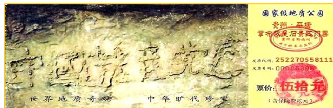
贵州平塘县掌布风景区内的“藏字石”，被中科院地质专家鉴定为距今2.7亿年，500年前从崖壁落下，石头断面上天然形成六个字： 中国共产党亡 (见上图风景区门票)。

李淳风曾将未来一千多年以后将发生的大事推算出来，并呈给太宗御览，这就是至今仍在广泛流传的《推背图》。这些预言千百年来被人们不断地验证，其真实可信程度令人叹为观止。值得一提的是，在他的预言中，还有关于法轮功传世，以及近十年来中共对法轮功的残酷迫害，和中共将因此走向灭亡的记载。（摘-明慧网）