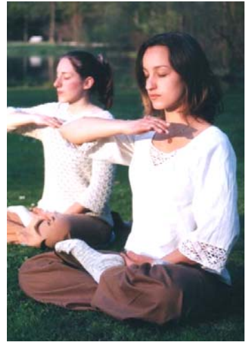
图：一对德国姐妹在炼功

法轮功也称法轮大法，是佛家上乘修炼大法，以“真善忍”为根本指导。经亿万人的修炼实践证明，法轮大法是大法大道，在把真正修炼的人带到高层次的同时，对稳定社会、提高人们的身体素质和道德水准，也起到了不可估量的正面作用。