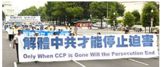
▲ 华盛顿反迫害十周年大游行。

美国著名智库“外交关系委员会”在2009年3月的一篇讨论中国人权问题的文章中间，在中共的各种敏感事务中，中共把什么排在最重要的位置呢？文章说，对中共而言，不管怎么排，排在