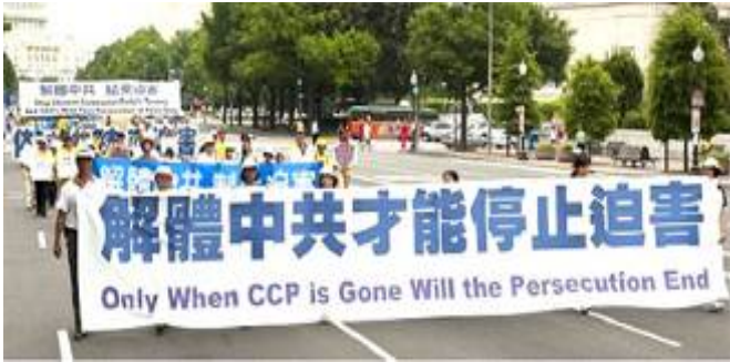
▲ 华盛顿反迫害十周年大游行。 ▼ 2002 年在贵州平塘县掌布乡发现的藏字石，石头断面上天然形成六个字：中国共产党亡，昭示着“天灭中共”的天意。图为风景区门票。

是如何把法轮功当作最大的敌人在打击。 中共把法轮功的善良民众强行推到了中共最大敌人的位置，也就决定了只有解体中共才能停止迫害的结局。◇文／欧阳非