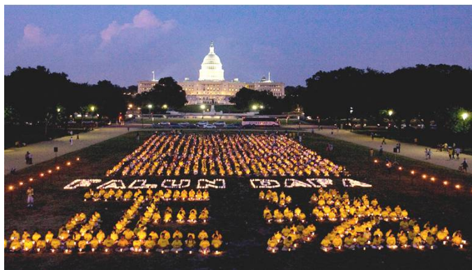
二零零九年七月十六日晚，美国国会山前法轮功学员烛光集会，悼念十年来被中共迫害致死的大陆同修，并组字“正法”和英文“法轮大法”。

【明慧网】二零零九年七月二十日，法轮功学员反迫害十周年之际，在亚、美、欧、澳各国的大集会和游行纷纷举行，呼吁更多人关注对法轮功的迫害，认清中共的邪恶，共同制止迫害。