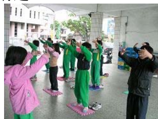
明慧社团练习法轮桩法

其实我认为炼功是可以把一些不好的东西给消除掉，可以让你把一些烦恼暂时忘记，让你到一个什么都不用做的世界。看影片则是让我们知道更多更多的明慧故事和「真、善、忍」的重要。如果一个人心