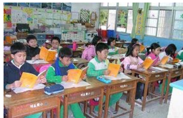
明慧社团阅读法轮功书籍

每到学期结束，总是要做一些检测，进行省思，这学期当然也不例外。记的学期开始，除了一二位生面孔外，其他就是老班底了，不过新生也很快就能跟上进程，所以整学期下来，学习过程是相当的平顺。以下就是花莲明义国小的明慧组小朋友跟大家的分享。