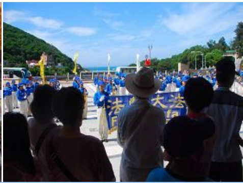
天国乐团在马祖民俗文物馆演奏时民众围观