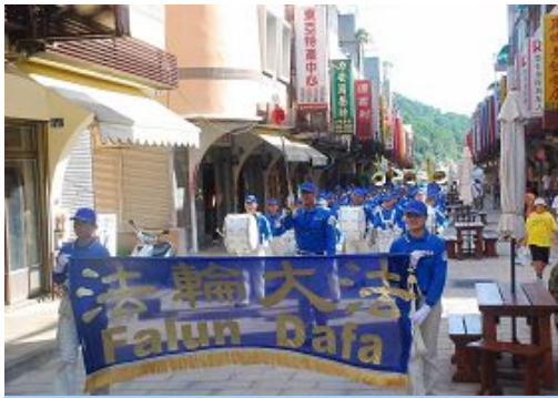
天国乐团巡行南竿马祖港热闹街道

两天以来，可以看到民众脸上的阴霾已经散开，喜悦飞上了眉梢；对于天国乐团的殊胜乐音仍意犹未尽，临别前还邀请乐团在海滨公园作临别演奏。当天晚上悦耳的音符在晚风里飘荡，飘向海峡对岸。