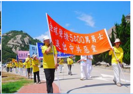
声援退党队伍行进在北竿岛

【明慧网】芬兰法轮功学员从二零零九年七月二十三日开始，在著名的旅游景点白教堂举办活动，向人们介绍法轮功以及发生在中国的迫害真相，并协助中国大陆游客退出中共党、团、队（简称“三退”）。