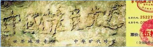
2002 年在 贵州平塘 县掌布乡 发现

大伙呼拉一下过来围著名单，争着挑选自己中意的名儿。连阴先生也要了个名儿。一年轻人悄声对王老太太说：“那个叫‘神了，神了’的人，就是我们那的公安厅长。”