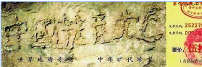
■ 2002 年在贵州平塘县掌布乡发现的藏字石，石头断面上天然形成六个字：中国共产党亡，昭示着“天灭中共”的天意。图为风景区门票。

大伙呼拉一下过来围著名单，争着挑选自己中意的名儿。连阴先生也要了个名儿。一年轻人悄声对王老太太说：“那个叫‘神了，神了’的人，就是我们那的公安厅长。”