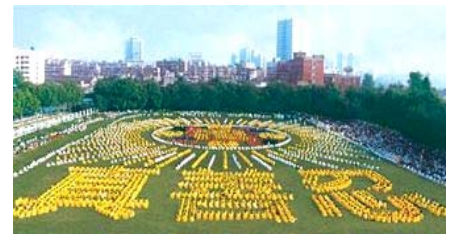
■一九九八年，武汉，五千多名法轮功学员集体炼功。