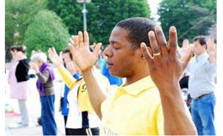
■“真善忍”的巨大威德和感召力超越国界，受到各族裔的珍视。图为今年五月法国法轮功学员在庆祝活动中集体炼功。

全世界大法弟子和善良的民众在每年的这一天举行各种庆典，分享大法带给生命的希望与美好。