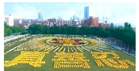
■一九九八年，武汉，五千多名法轮功学员集体炼功。