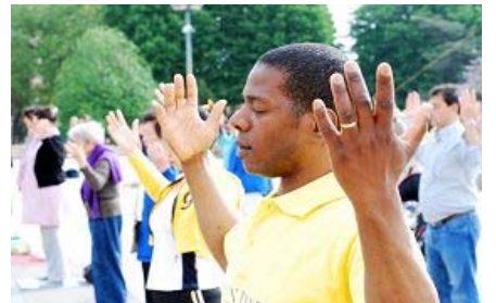
■“真善忍”的巨大威德和感召力超越国界，受到各族裔的珍视。图为今年五月法国法轮功学员在庆祝活动中集体炼功。

全世界大法弟子和善良的民众在每年的这一天举行各种庆典，分享大法带给生命的希望与美好。