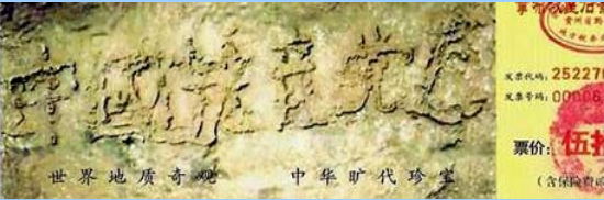
■ 2002年在贵州平塘县掌布乡发现的藏字石, 石头断面上天然形成六个字: 中国共产党亡, 昭示着“天灭中共”的天意。图为风景区门票。

大伙呼拉一下过来围著名单，争着挑选自己中意的名儿。连阴先生也要了个名儿。一年轻人悄声对王老太太说：“那个叫‘神了，神了’的人，就是我们那的公安厅长。”