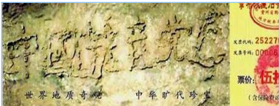
2002 年在贵州平塘县掌布乡发现

大伙呼拉一下过来围著名单，争着挑选自己中意的名儿。连阴先生也要了个名儿。一年轻人悄声对王老太太说：“那个叫‘神了，神了’的人，就是我们那的公安厅长。”