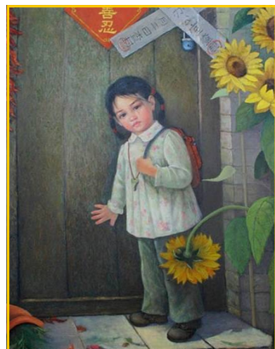
■油画《无家可归》，讲述受中共迫害的法轮功学员的孩子放学后发现无家可归。