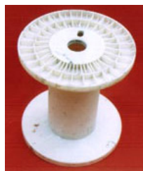
佳木斯劳教所刑具

因为妈妈坚持为大法鸣冤,于 2000 年 7 月 2 日进京上访,被双鸭山公安局非法劳教一年。第二次被非法劳教没有任何原由。2002 年正月初九,那是一个难忘的日子,因为那天是我的生日。下午,妈妈正准备给我庆祝生日,突然来了四个警察,二话不说将妈妈强行绑架,随后非法劳教两年。在那两年中,妈妈被劳教所警察和刑事犯折磨着。每天坐小凳,小凳是一个包线轱辘,直径为 20 厘米,高为 30 厘米,上有很多碎格。坐此刑具时,双手被要求放在膝盖上,脚不能出 40 公分的地砖格,腰要挺直,整天整宿的坐。如有不从就被拳打脚踢,后把双手伸开铐在床上。穿着棉裤三、四天下下来,臀部皮开肉绽,行走困难。妈妈还被强迫看诽谤法轮功的录像片;因为妈妈不放弃信仰,被干警戴大背铐数日,受尽折磨。