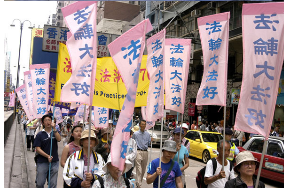
▲香港“法轮大法好”彩旗飘扬